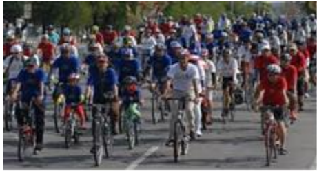
กรุงเทพมหานคร