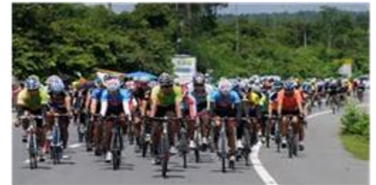
ในส่วนภูมิภาค